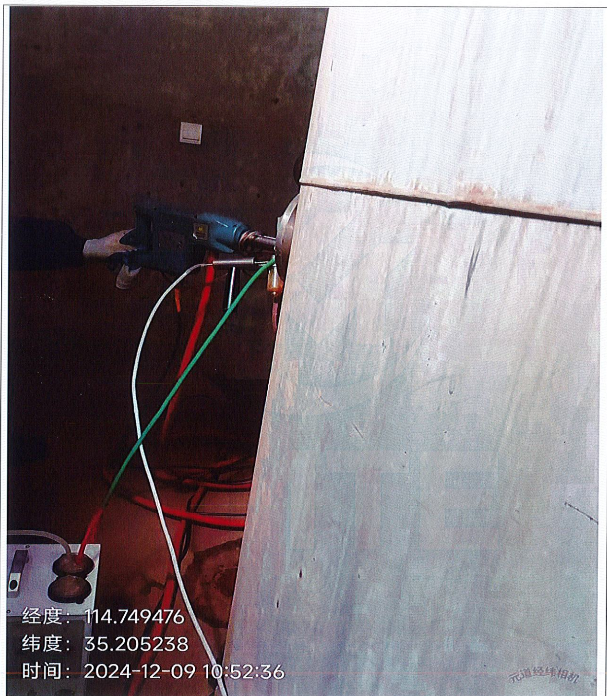
图 2-1 有组织检测 3#焚烧废气排放口 DA003