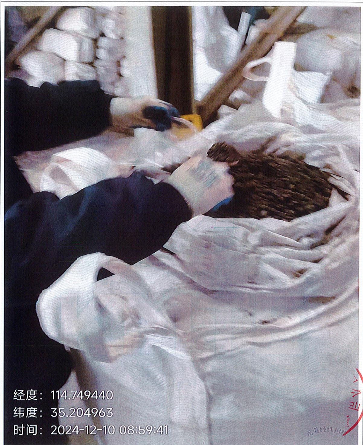
图 2-1 固废检测 稳定化处理后飞灰