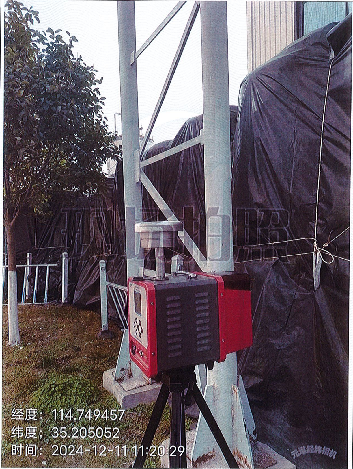
图 2-1 无组织检测 飞灰整合车间