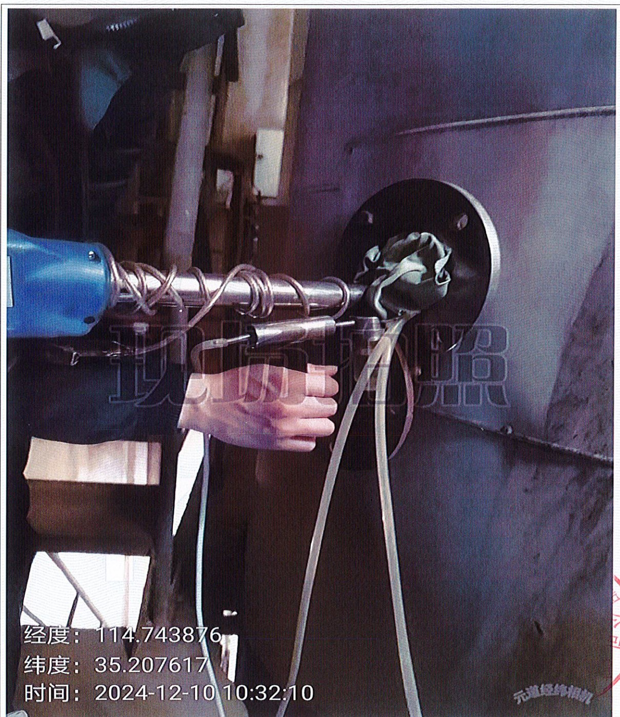
图 2-1 废气检测 3#焚烧废气排放口 DA003