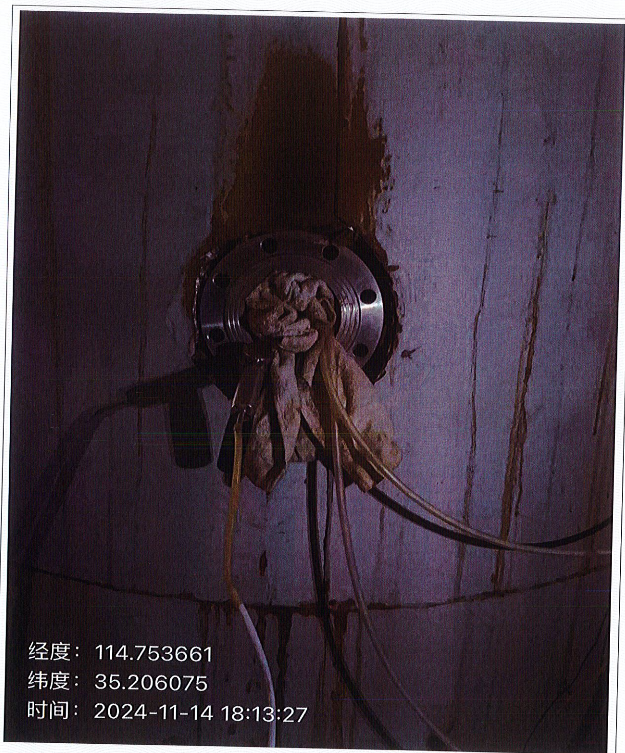
图 2-1 废气检测 1#焚烧废气排放口 DA001