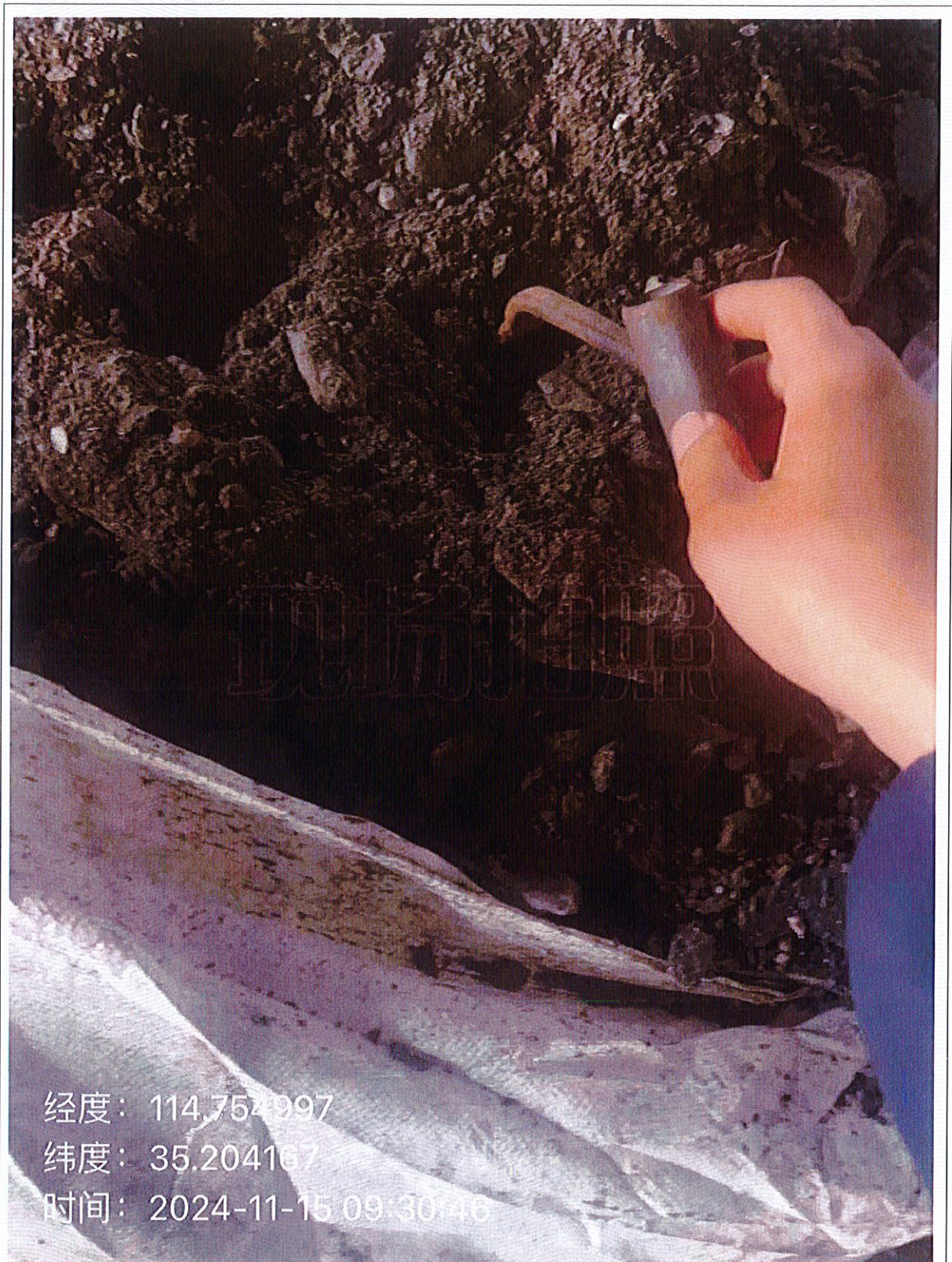
图 2-1 固废检测 稳定化处理后飞灰