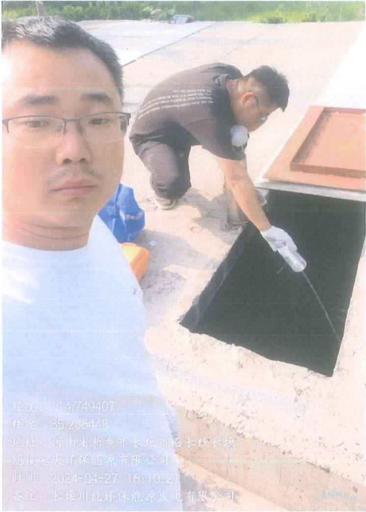
附件：长垣川能环保能源发电有限公司现场检测照片