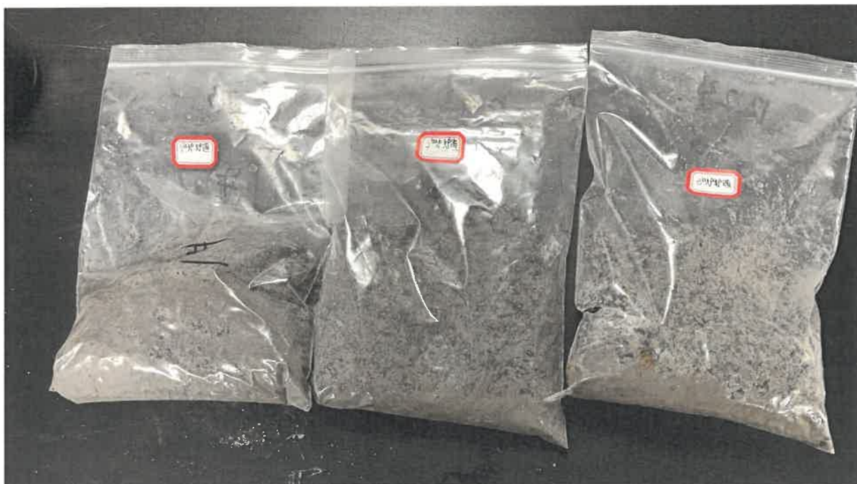
图 5-1 客户送样图片