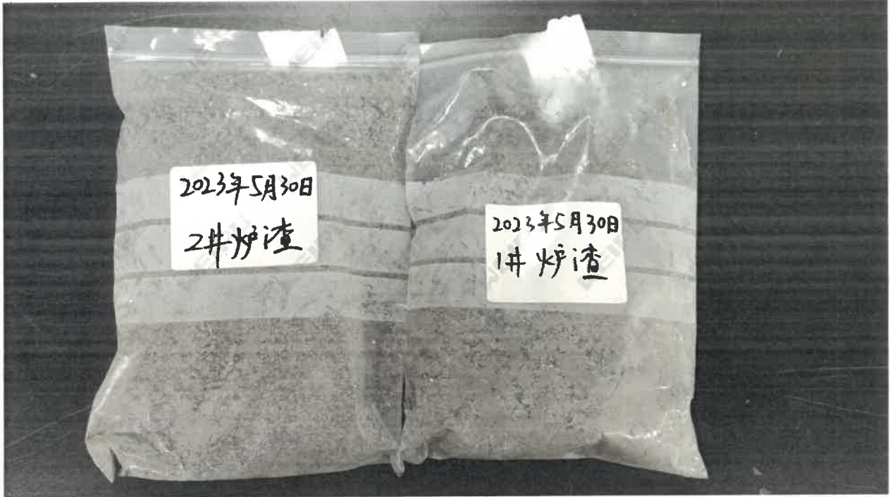
图 5-1 客户送样图片