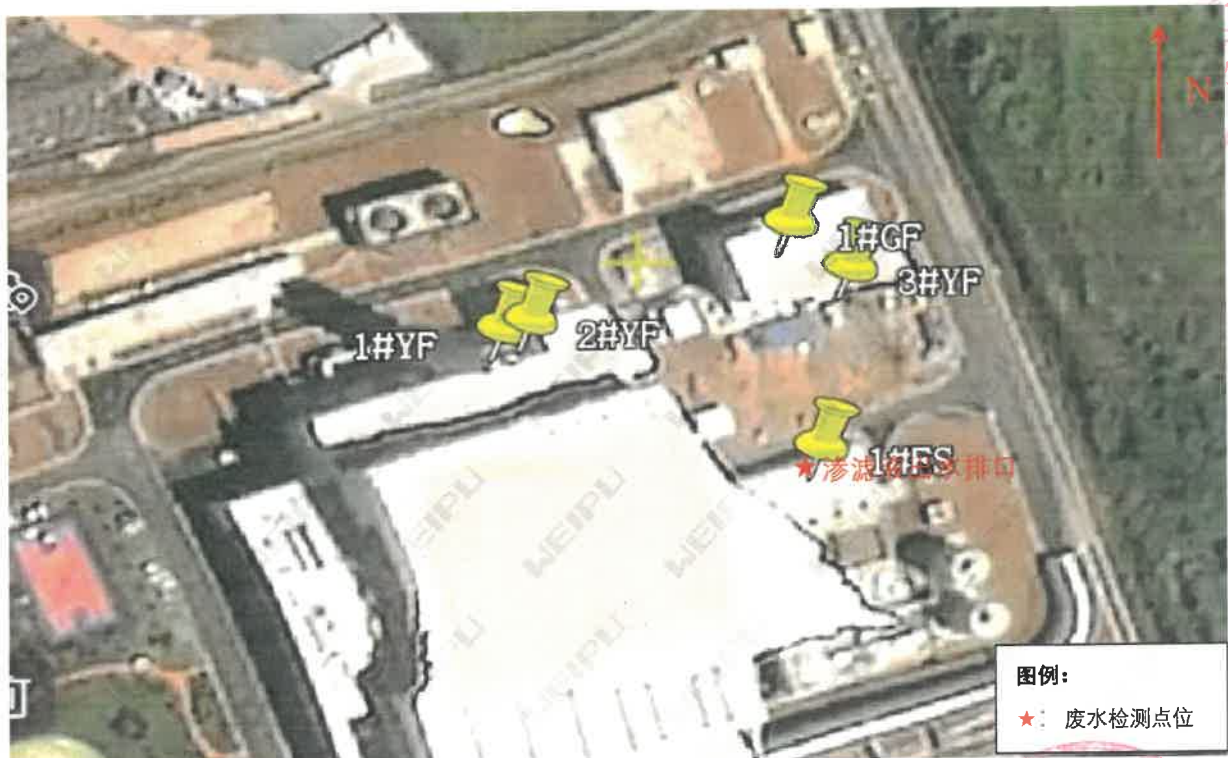
图 5-1 检测点位示意图