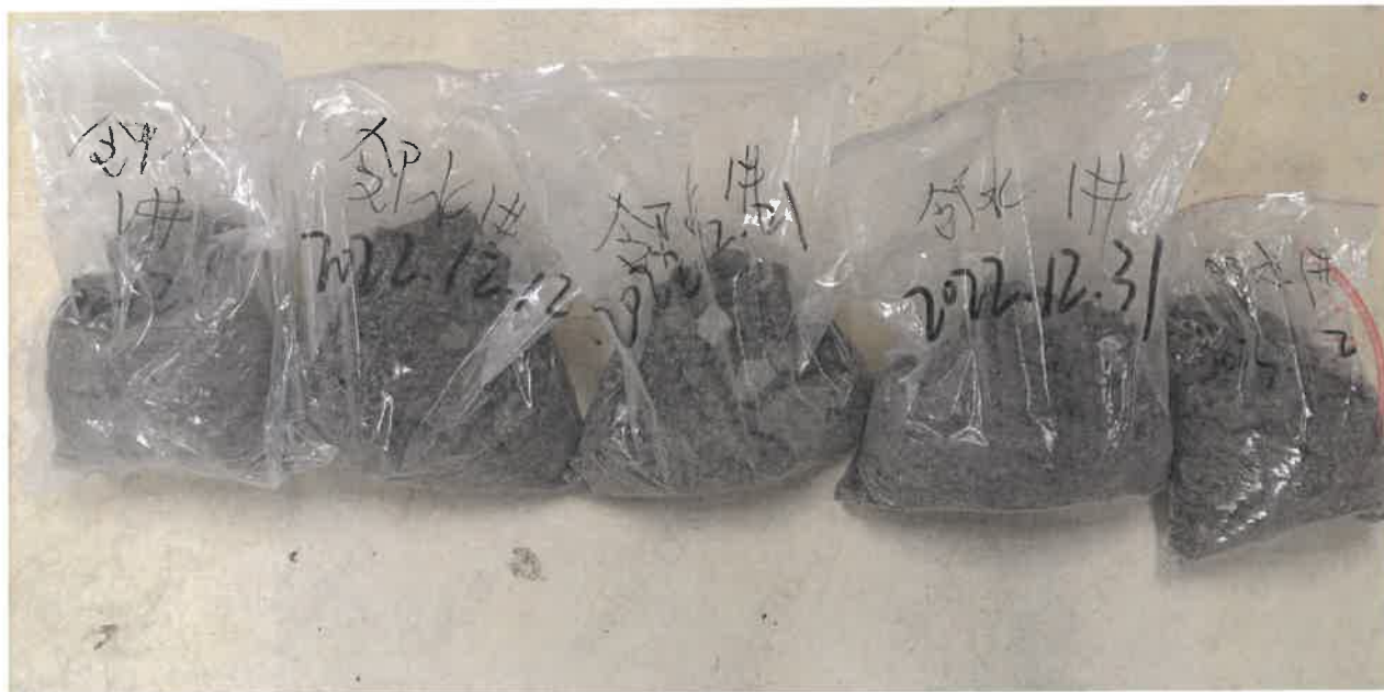
图 5-2 客户送样图片