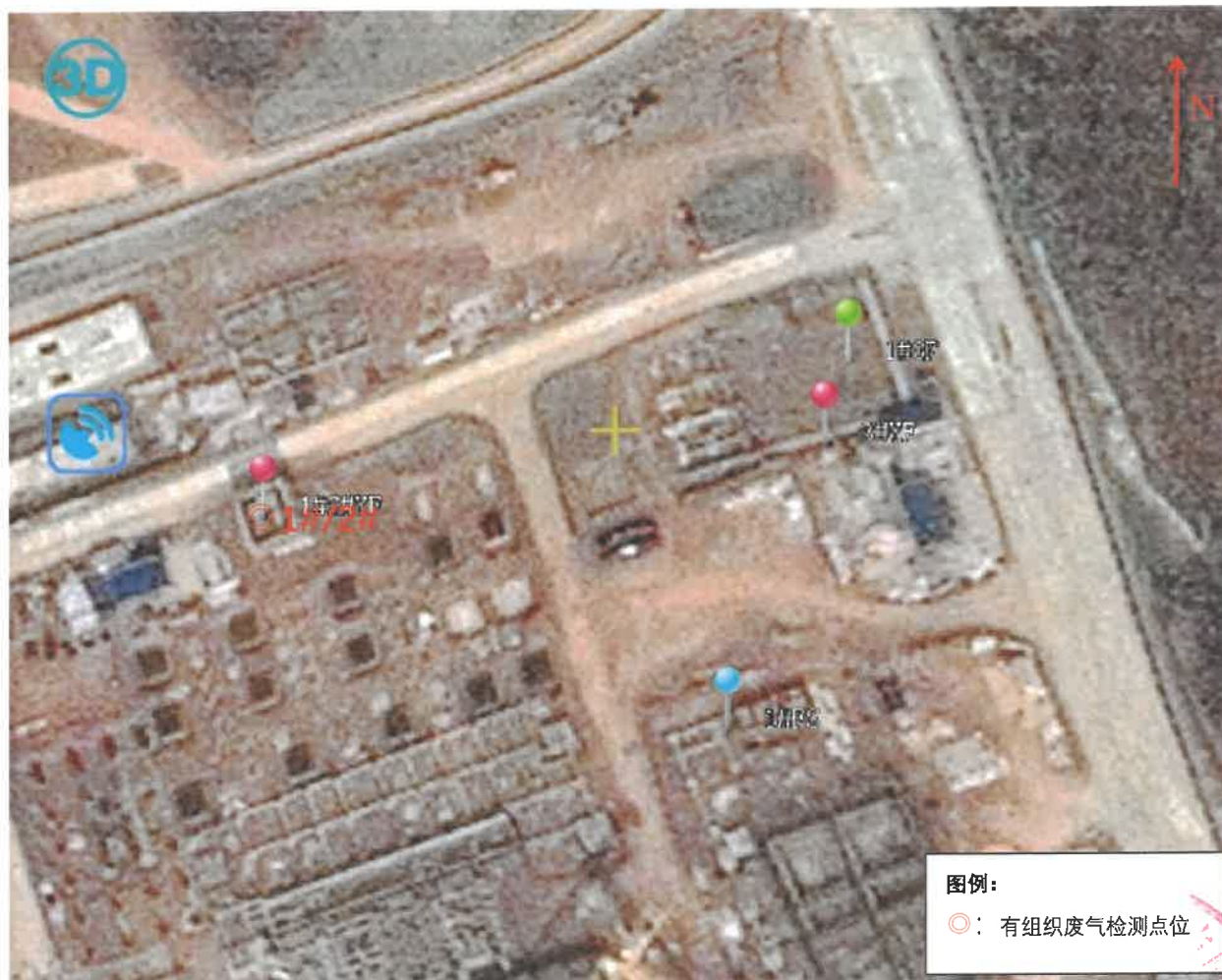
图 5-1 检测点位示意图