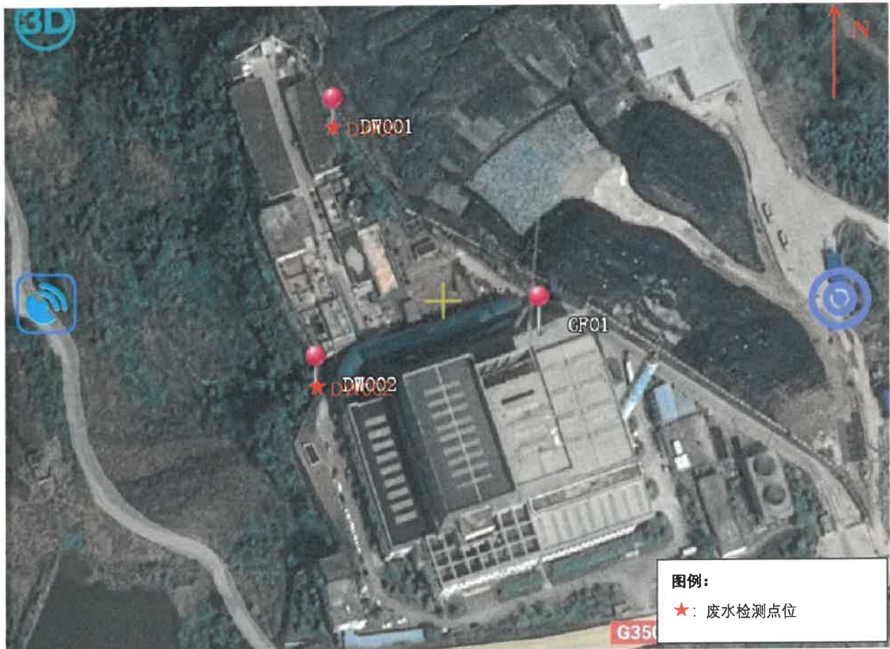
图 5-1 检测点位示意图