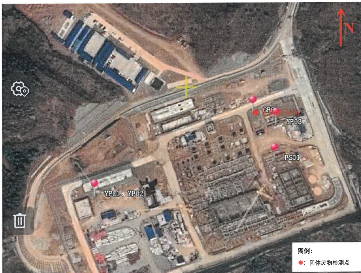
图 5-1 检测点位示意图