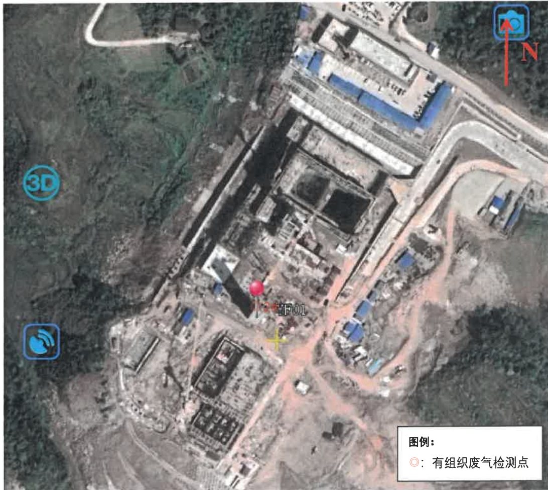
图 5-1 检测点位示意图