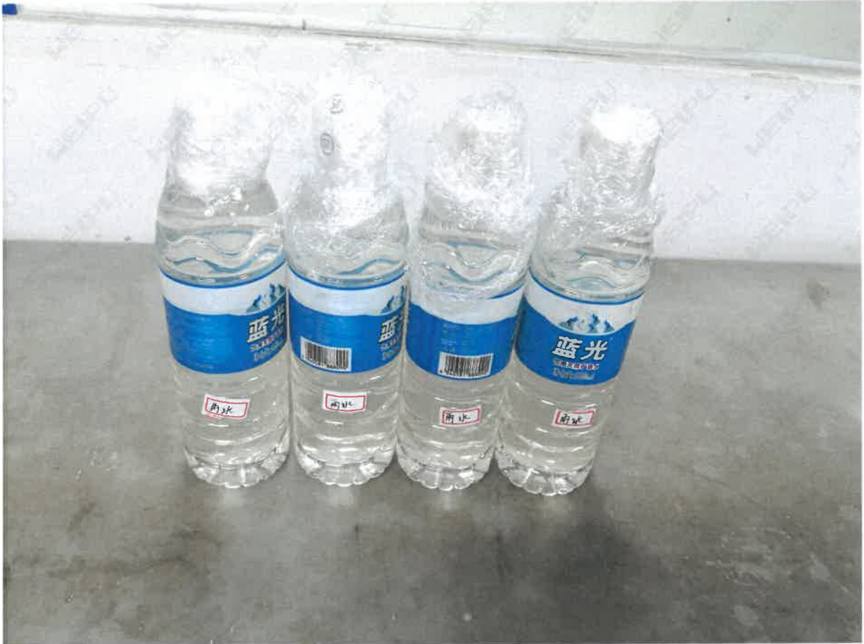
图 5-1 客户送样照片